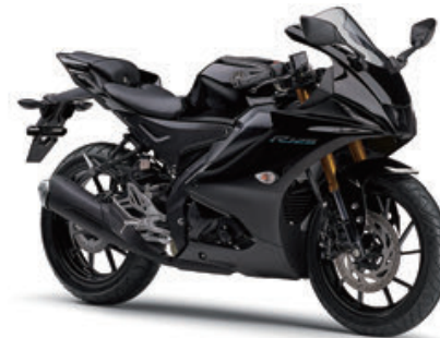
ブラックメタリック12 (ブラック)