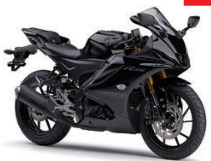
ブラックメタリック12 (ブラック)