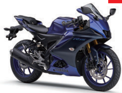
ディーパーブリッシュブルーメタリックC (ブルー)