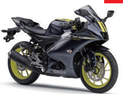
ダークブルーイッシュグレーメタリック9 (ダークグレー)