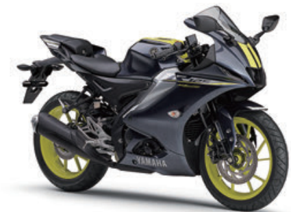
ダークブルー-イッシュグレイメタリック9 (ダークグレー)